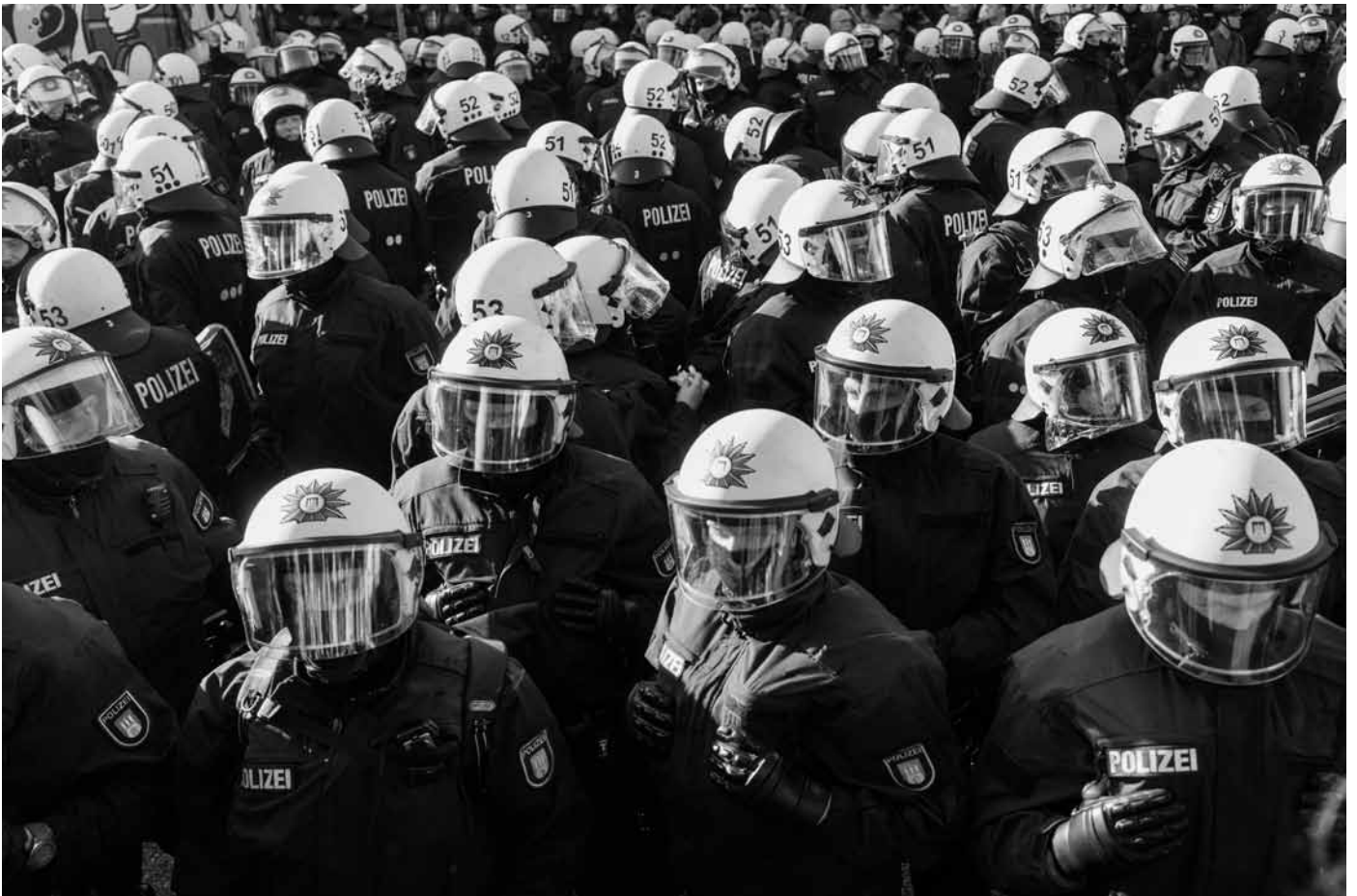
G20 GIPFEL – HAMBURG – «WELCOME TO HELL» – (DO, 06.07.2017)

Die Kundgebung «Welcome to hell» wird gleich zu Beginn gestoppt. Der Schwarze Block läuft nur wenige Meter weit.