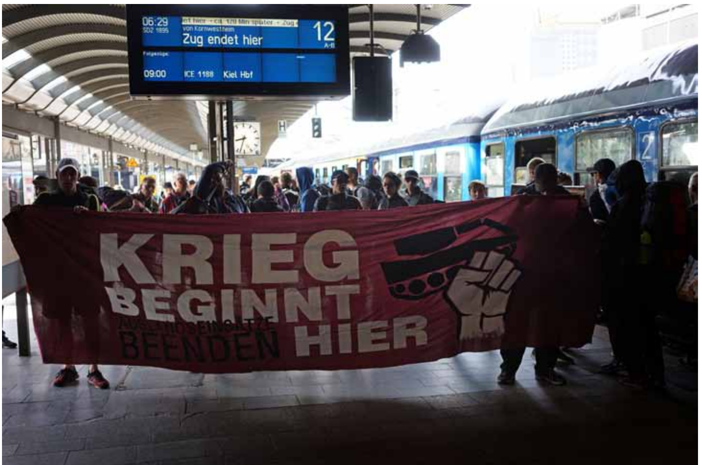
G20 GIPFEL – HAMBURG – SONDERZUG – (DO, 06.07.2017) Wo die Zugfahrt endet, beginnt der Protest.