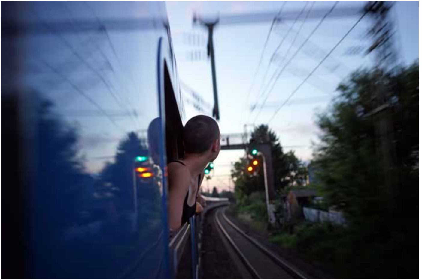
G20 GIPFEL – HAMBURG – SONDERZUG – (MI, 05.07.2017) 800 Mitreisende fahren ungestört durch die Sommernacht.