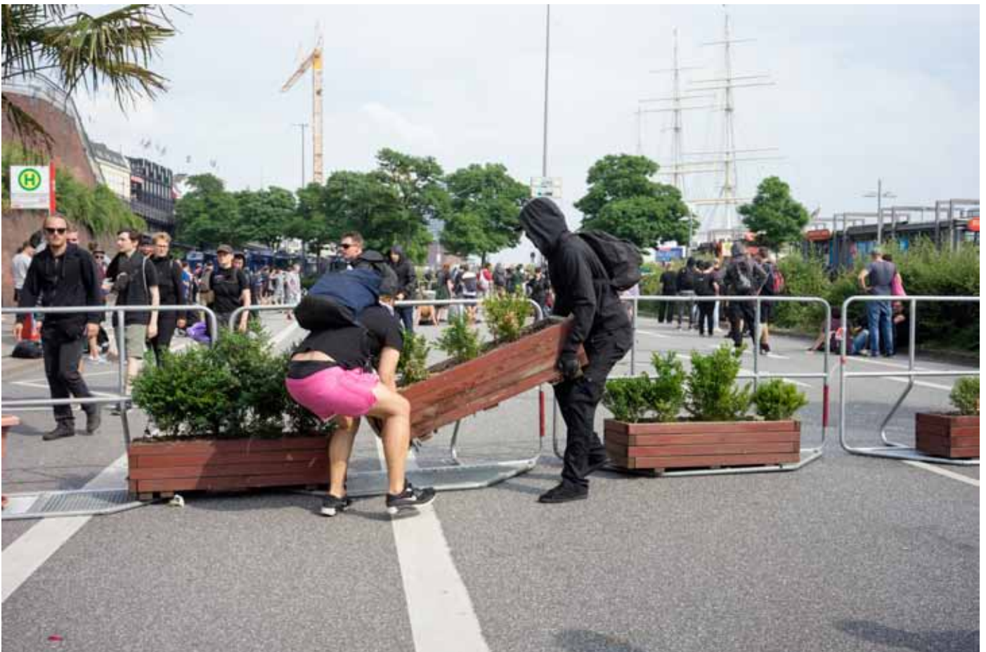
G20 GIPFEL – HAMBURG – BLOCKADE – (FR, 07.07.2017)

Die Hochwasserschutzwand vor der Elbphilharmonie wird vor dem G20-Konzert hochgefahren, um GipfelgegnerInnen daran zu hindern, in die Nähe des Gebäudes zu gelangen.