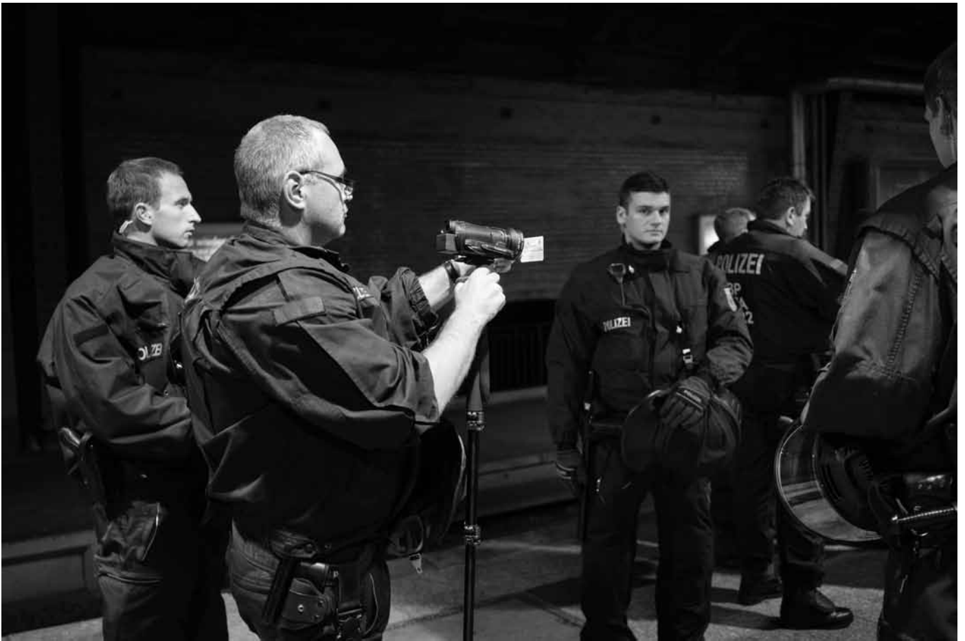
G20 GIPFEL – HAMBURG – SONDERZUG – (SA, 08.07.2017)

Videografierung am Hamburger Hauptbahnhof bei der Rückreise des Sonderzugs nach Basel.