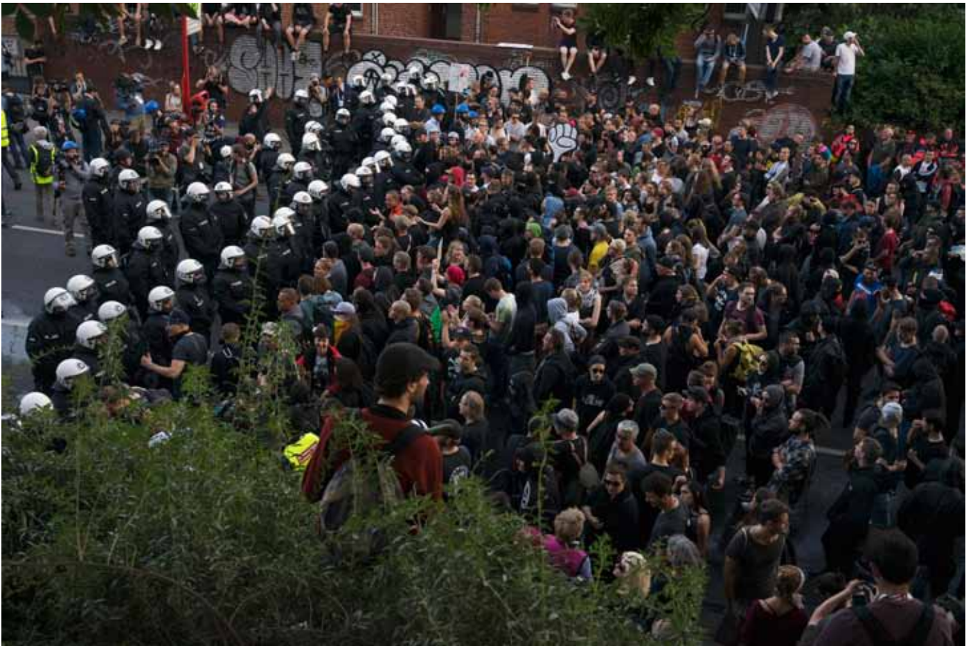
G20 GIPFEL – HAMBURG – «WELCOME TO HELL» – (DO, 06.07.2017)

Der neu formierte Demonstrationsumzug wartet auf die Erlaubnis, ihre Kundgebung fortzusetzen.