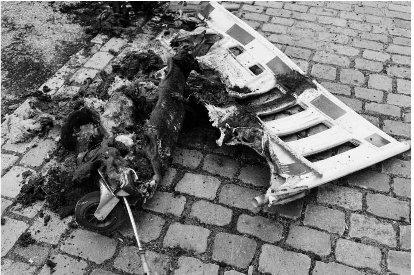
G20 GIPFEL – HAMBURG – SCHANZENVIERTEL – (FR, 07.07.2017) Verbrannter Müllcontainer nach «Welcome to hell»-Demonstration an der Eimsbütteler Chaussee.