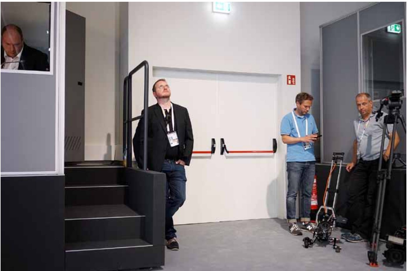
G20 GIPFEL – HAMBURG – MESSEGELÄNDE – (SA, 08.07.2017) Medienschaffende warten auf die Pressekonferenz der Kanzlerin Angela Merkel.