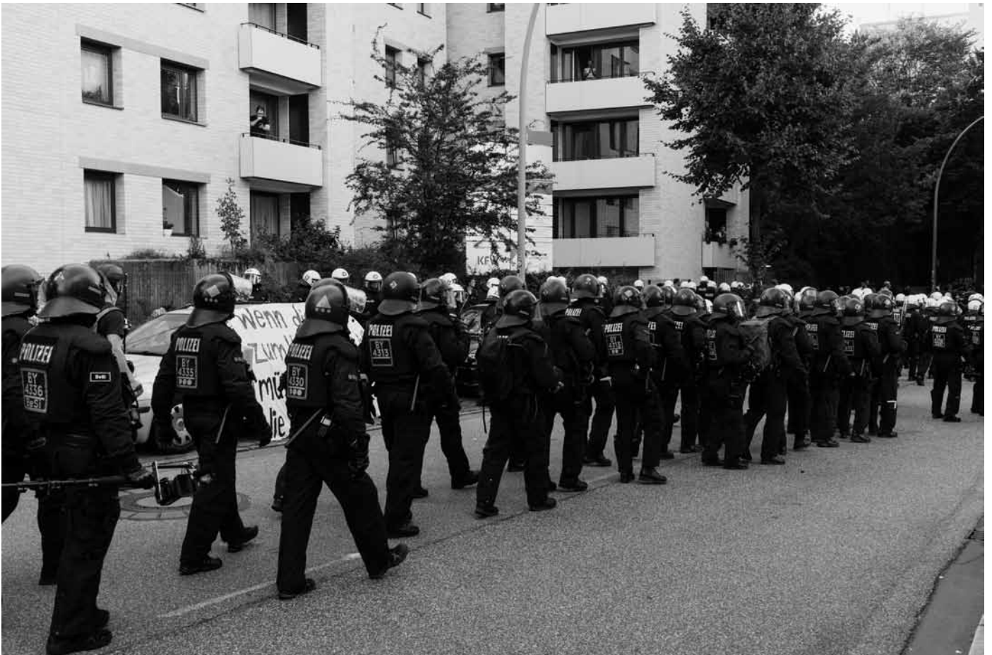
G20 GIPFEL – HAMBURG – «WELCOME TO HELL» – (DO, 06.07.2017) Einsatz der Polizei in Zweierreihen um die Demonstrierenden auseinander zu dividieren und den Umzug aufzulösen.