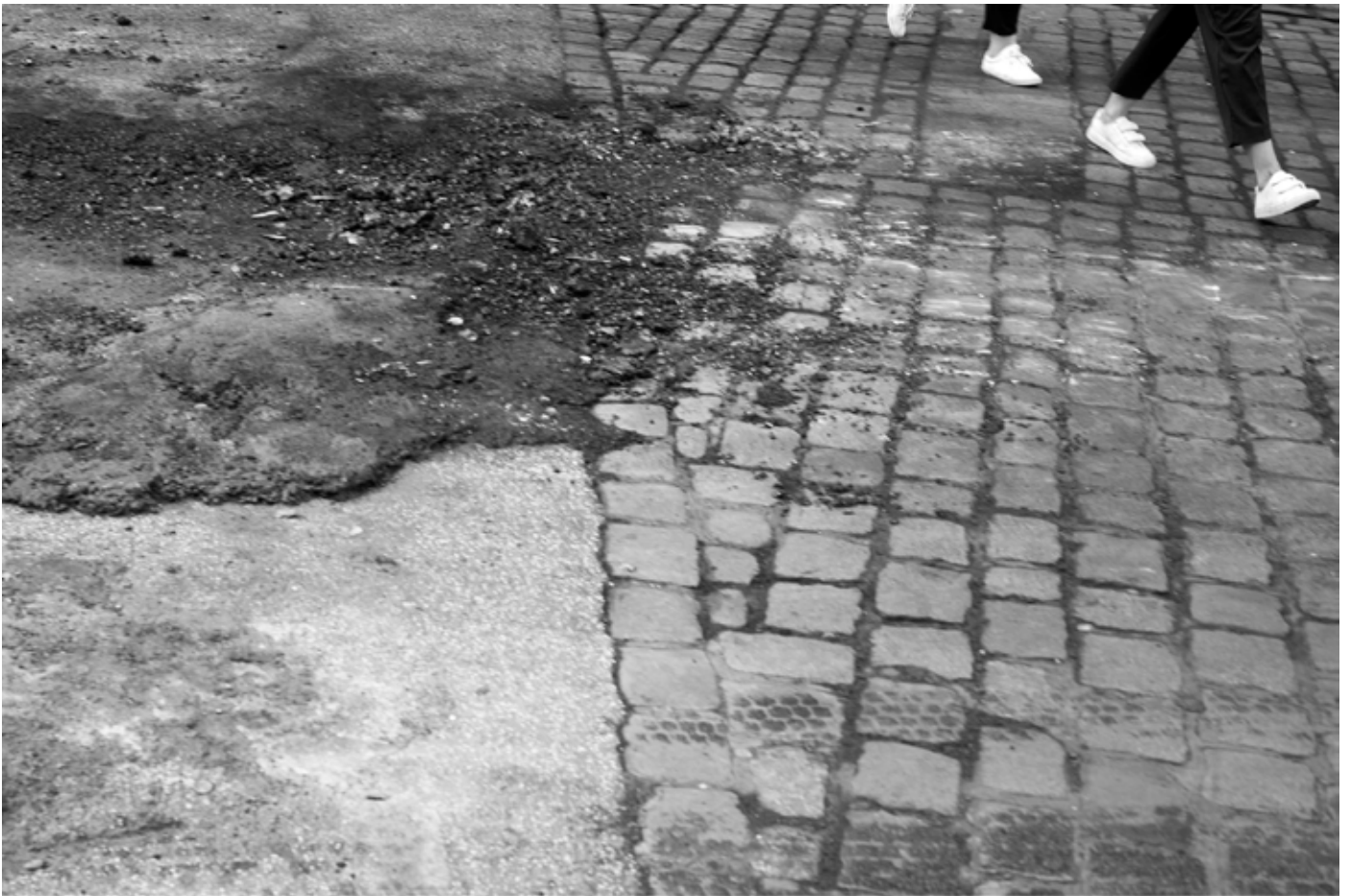
G20 GIPFEL – HAMBURG – SCHANZENVIERTEL – (SA, 08.07.2017) Verbrannte Überreste der Strassenblockade im Schanzenviertel.