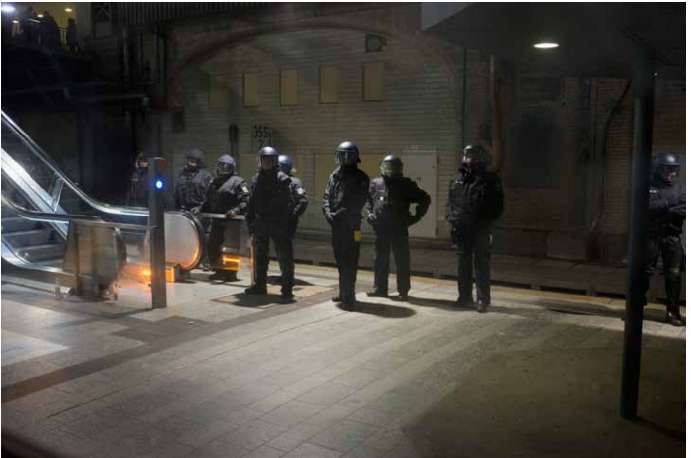
G20 GIPFEL – HAMBURG – SONDERZUG – (SA, 08.07.2017) Rückfahrt Sonderzug im Hauptbahnhof Hamburg nach Basel.