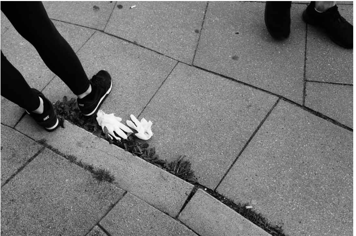
G20 GIPFEL – HAMBURG – «WELCOME TO HELL» – (DO, 06.07.2017) Handschuhe im Strassengraben während der Demonstration.