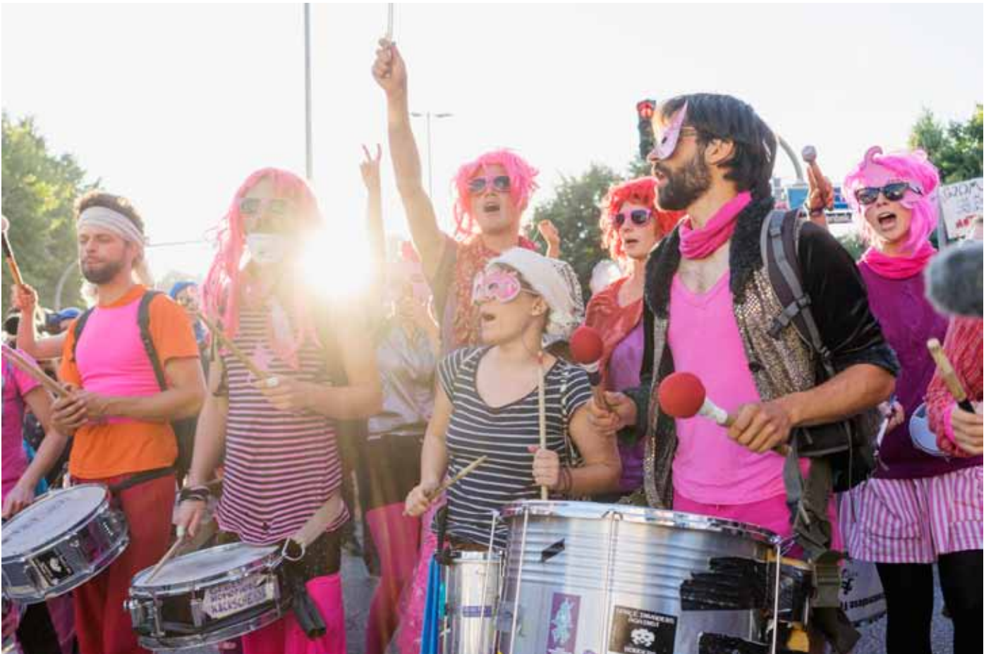
G20 GIPFEL – HAMBURG – «WELCOME TO HELL» – (DO, 06.07.2017)

Der neu formierte Demonstrationsumzug wartet auf die Erlaubnis, ihre Kundgebung fortzusetzen.