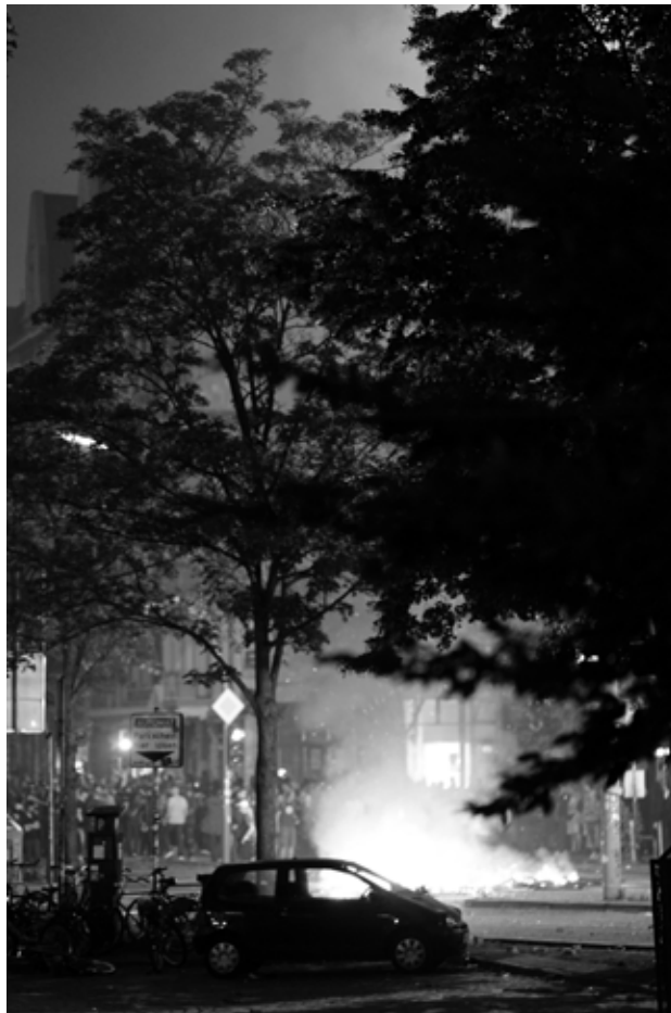
G20 GIPFEL – HAMBURG – SCHANZENVIERTEL – (FR, 07.07.2017) Brennende Strassenblockade am Eingang zum Schanzenviertel.