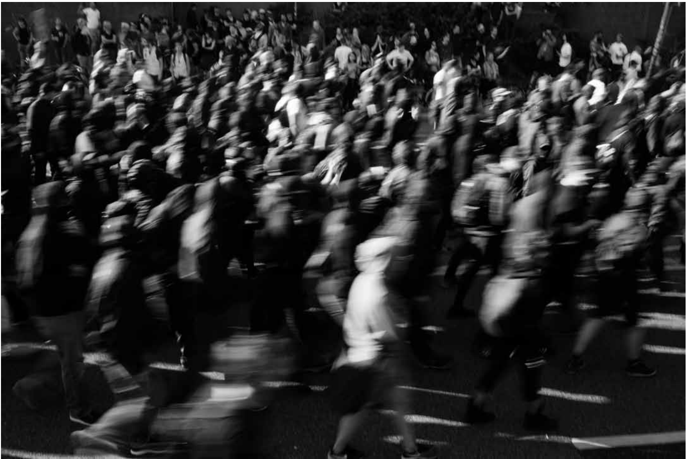
G20 GIPFEL – HAMBURG – «WELCOME TO HELL» – (DO, 06.07.2017)

Die Kundgebung «Welcome to hell» wird gleich zu Beginn gestoppt. Der Schwarze Block läuft nur wenige Meter weit.