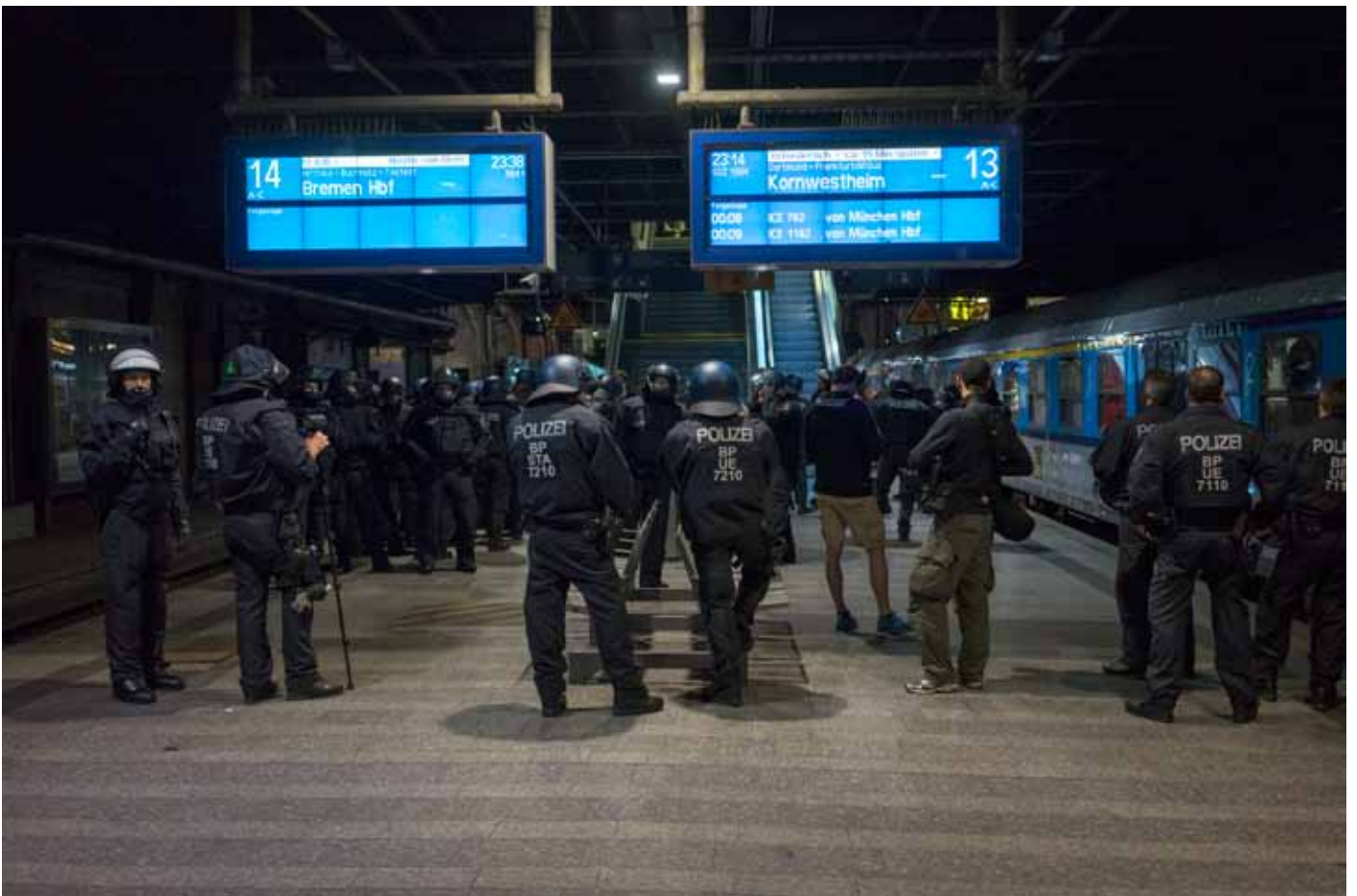
G20 GIPFEL – HAMBURG – SONDERZUG – (SA, 08.07.2017)

Videografierung am Hamburger Hauptbahnhof bei der Rückreise des Sonderzugs nach Basel.