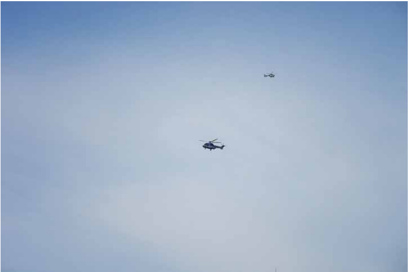
G20 GIPFEL – HAMBURG – HIMMEL ÜBER HAMBURG – (FR, 07.07.2017)

Überwachungshelikopter sind während vier Tagen ununterbrochen im Einsatz.