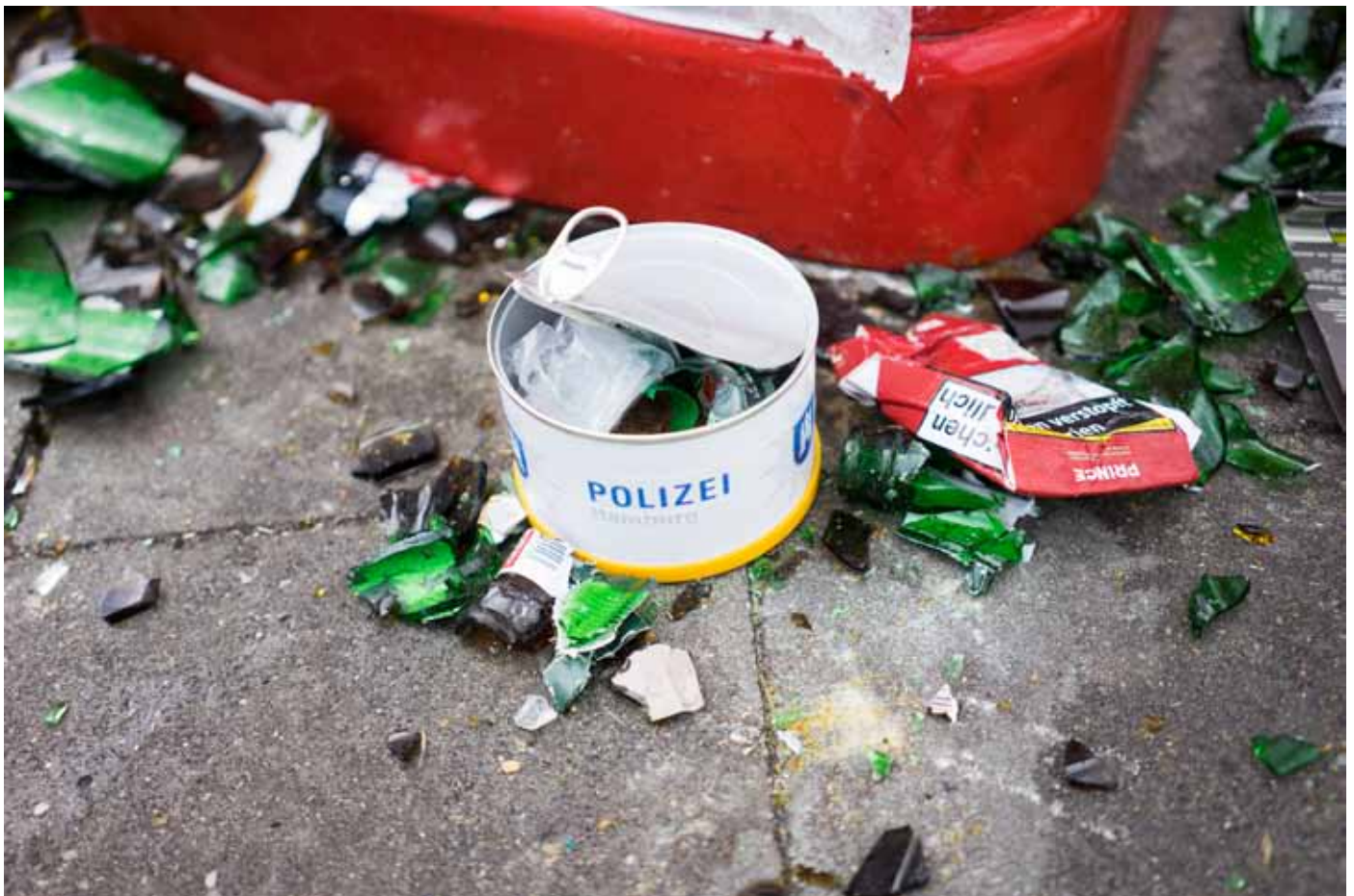
G20 GIPFEL – HAMBURG – ST. PAULI – (SA, 08.07.2017) Zigarettenpackung, Roggenvollkornbrotdose der Polizei und Glasscherben nach der Krawallnacht.