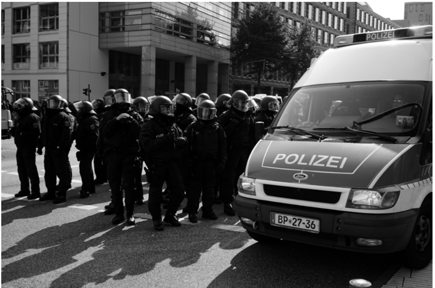
G20 GIPFEL – HAMBURG – BLOCKADE – (FR, 07.07.2017)

Palmblockade, um die Zufahrt der GipfelteilnehmerInnen zur Elbphilharmonie zu verhindern, Landungsbrücke.