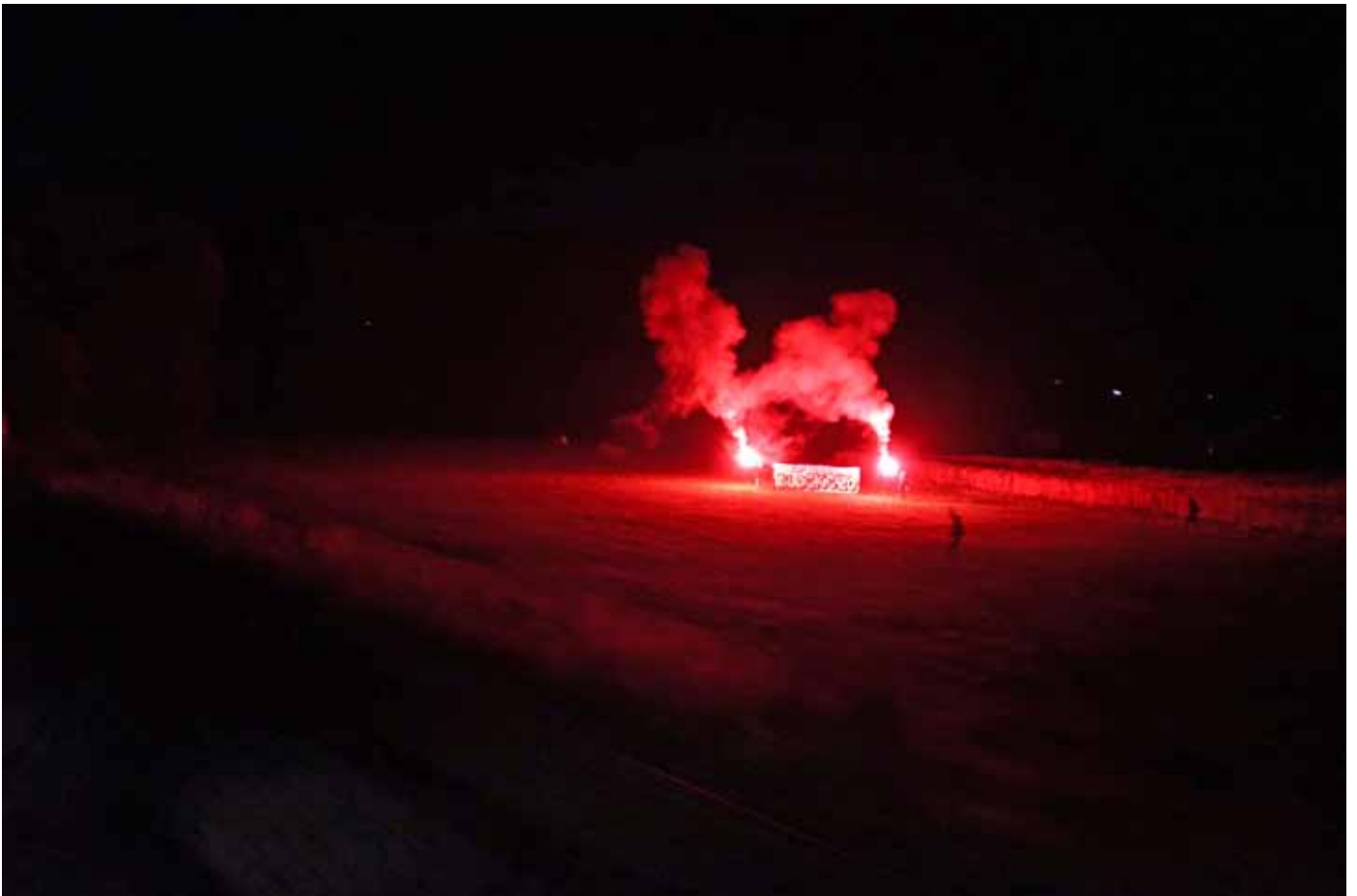
G20 GIPFEL – HAMBURG – SONDERZUG – (MI, 05.07.2017) Solidaritätspyros für den Sonderzug auf dem Weg nach Hamburg.