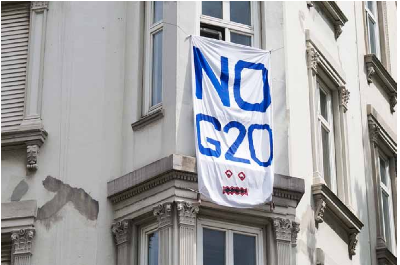
G20 GIPFEL – HAMBURG – ST. PAULI – (SA, 08.07.2017) Protestfahne an einem Gebäude auf St. Pauli.