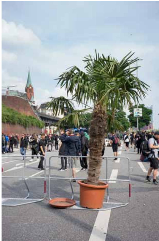
G20 GIPFEL – HAMBURG – BLOCKADE – (FR, 07.07.2017)

Palmblockade, um die Zufahrt der GipfelteilnehmerInnen zur Elbphilharmonie zu verhindern, Landungsbrücke.