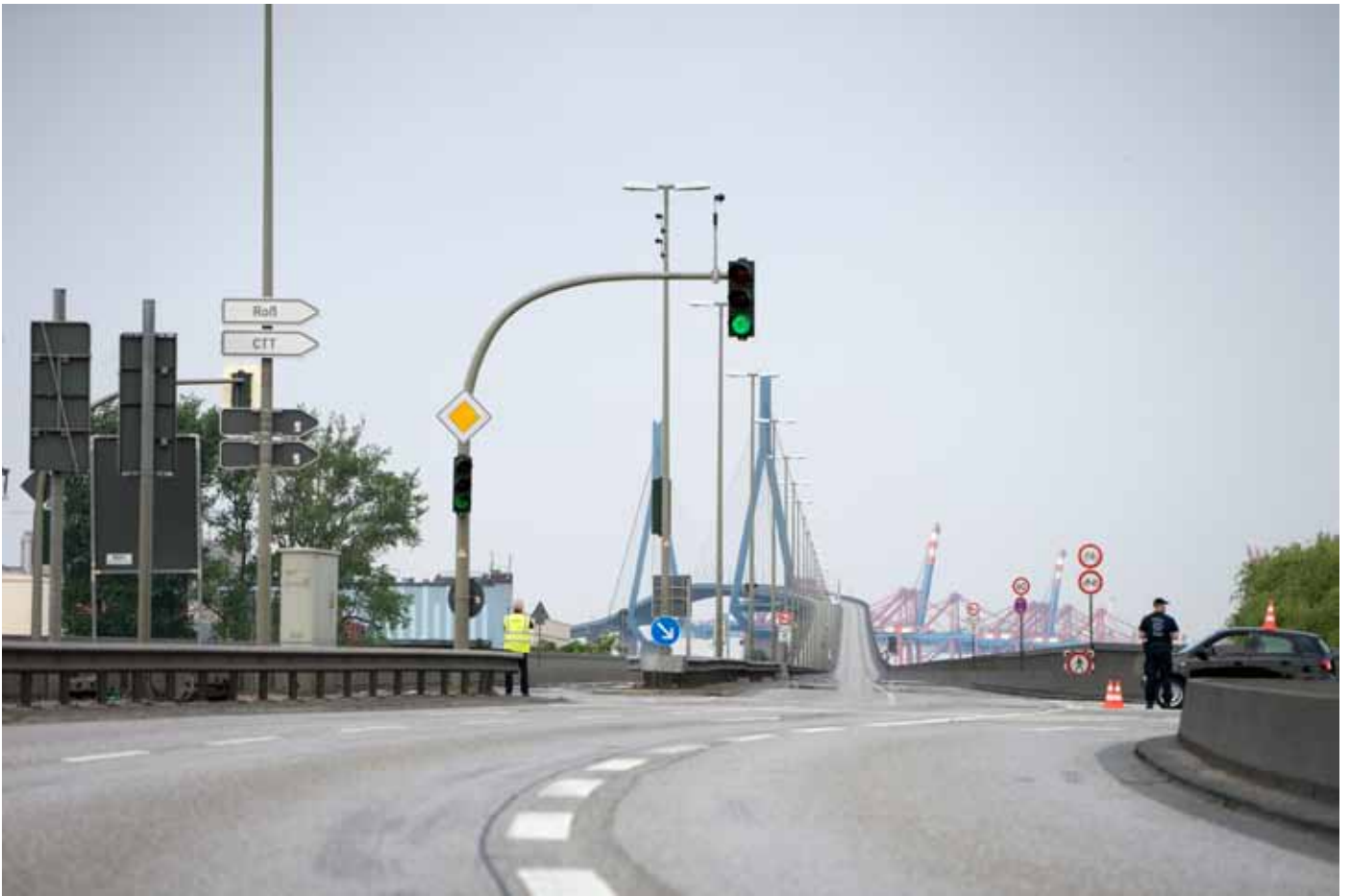
G20 GIPFEL – HAMBURG – BLOCKADE – (FR, 07.07.2017)

Die «Shut down the logistics of capital»-Blockade der Köhlbrandbrücke durch GipfelgegnerInnen stoppt den LKW-Verkehr ins Hafenviertel.