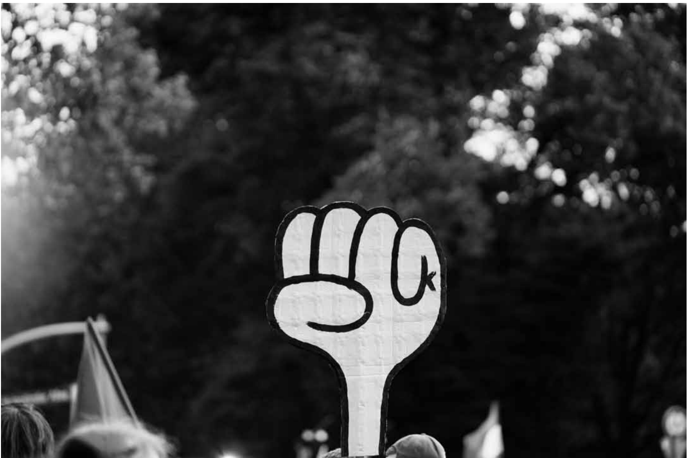
G20 GIPFEL – HAMBURG – DEMONSTRATION – (SA, 08.07.2017)

Abschlusspressekonferenz: Angela Merkel informiert über die Ergebnisse des G20-Gipfels.