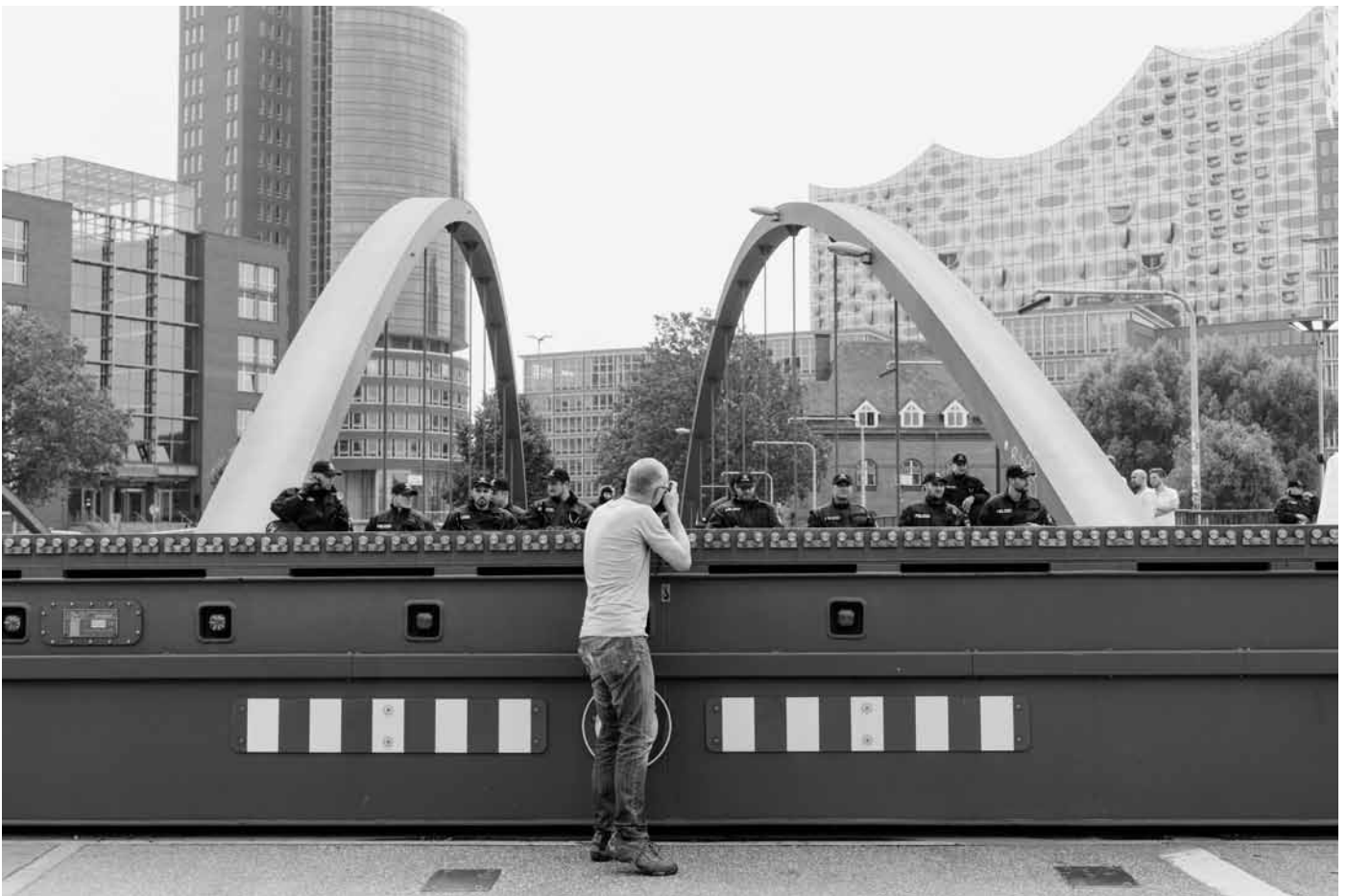
G20 GIPFEL – HAMBURG – BLOCKADE – (FR, 07.07.2017)

Die Hochwasserschutzwand vor der Elbphilharmonie wird vor dem G20-Konzert hochgefahren, um GipfelgegnerInnen daran zu hindern, in die Nähe des Gebäudes zu gelangen.