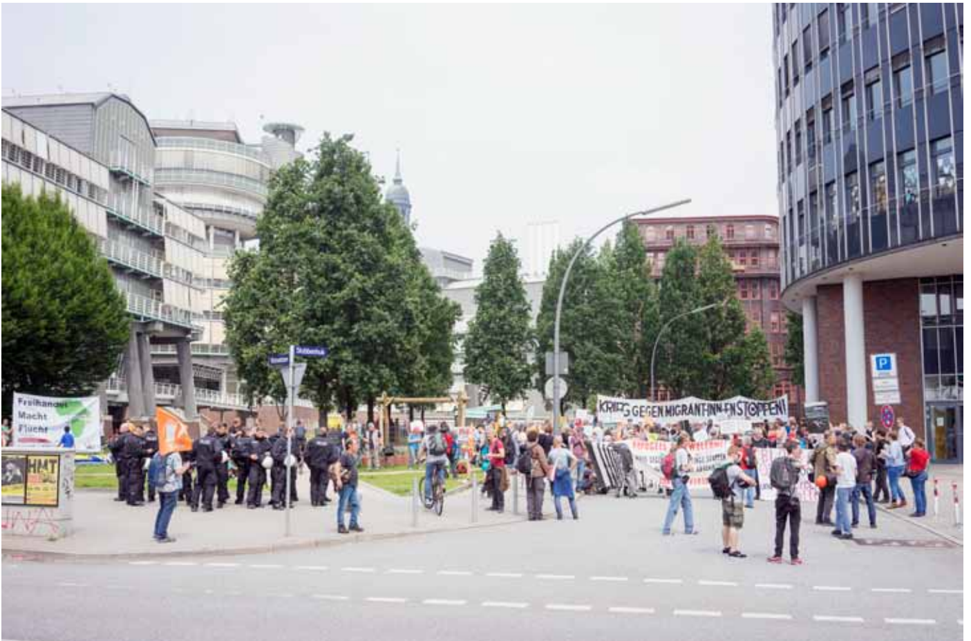
G20 GIPFEL – HAMBURG – DEMONSTRATION – (FR, 07.07.2017)

Die «Shut down the logistics of capital»-Blockade der Köhlbrandbrücke durch GipfelgegnerInnen stoppt den LKW-Verkehr ins Hafenviertel.