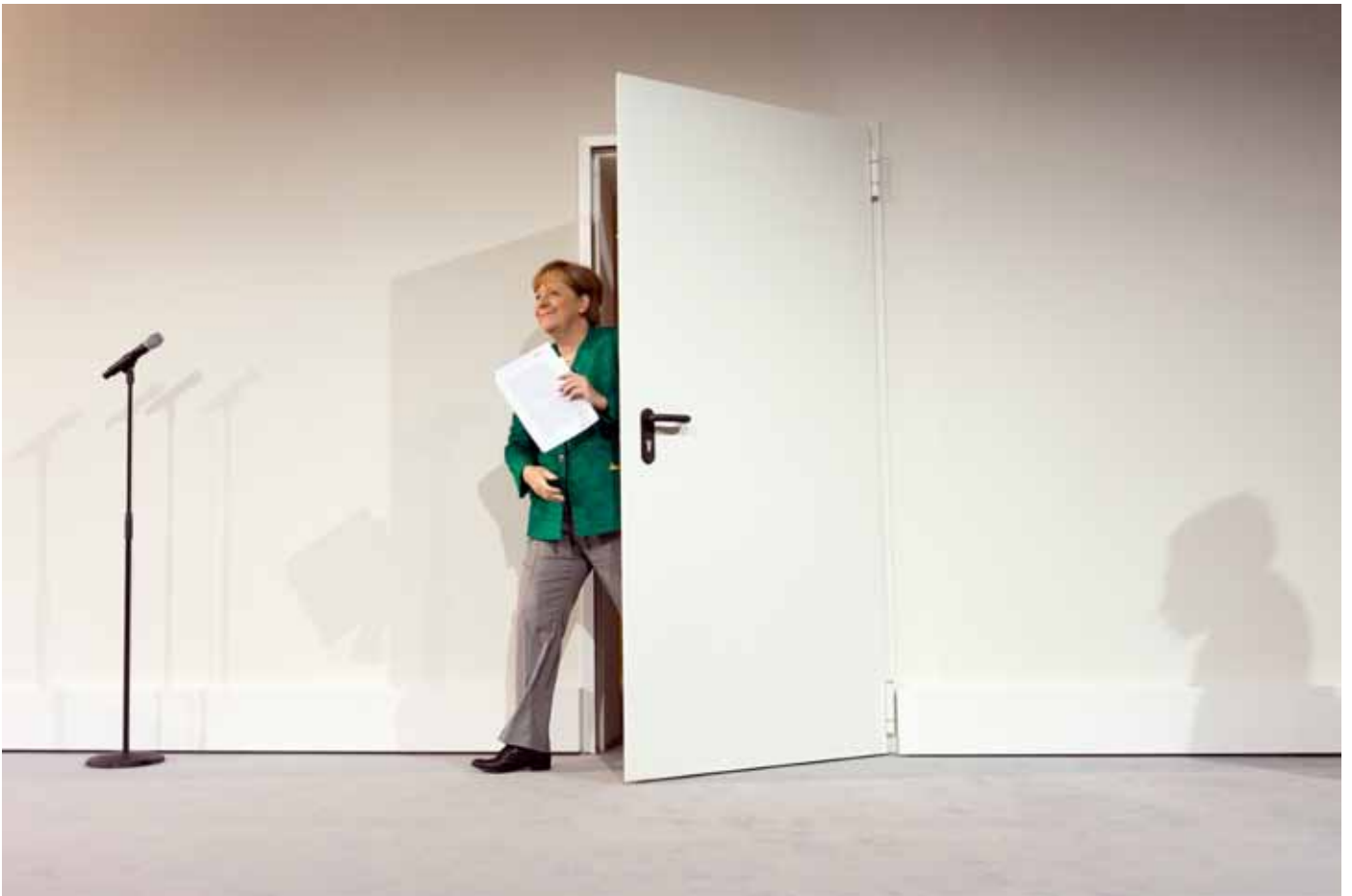
G20 GIPFEL – HAMBURG – MESSEGELÄNDE – (SA, 08.07.2017)

Abschlusspressekonferenz: Angela Merkel informiert über die Ergebnisse des G20-Gipfels.