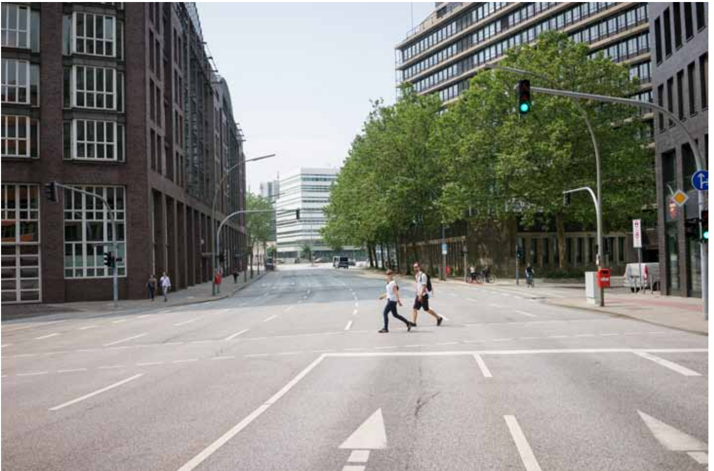
G20 GIPFEL – HAMBURG – BLOCKADE – (FR, 07.07.2017) Geisterstadt Hamburg: entleerte Innenstadt durch «Color the red zone»-Blockade von GipfelgegnerInnen, hier Kreuzung Domstrasse / Ecke Willy-Brand-Strasse.