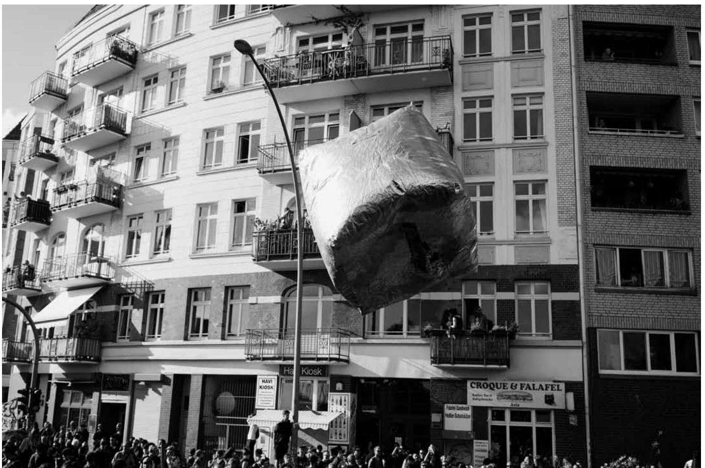
G20 GIPFEL – HAMBURG – «WELCOME TO HELL» – (DO, 06.07.2017) Versammlung zur Demonstration «Welcome to hell»