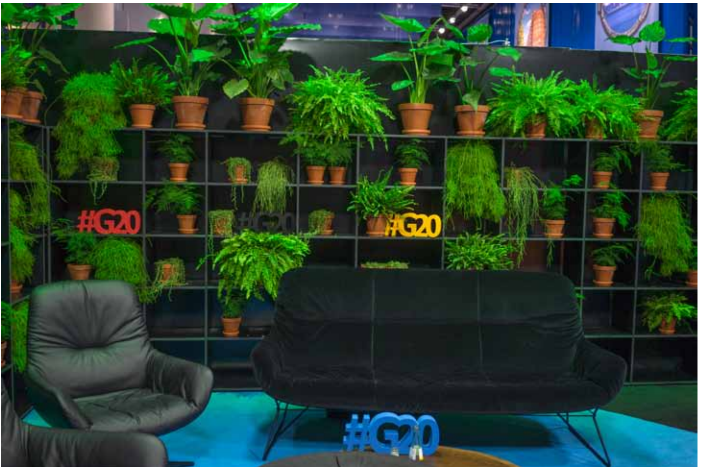
G20 GIPFEL – HAMBURG – MESSEGELÄNDE – (FR, 07.07.2017) Plastikpflanzenlounge im offiziellen Medienzentrum des G20.